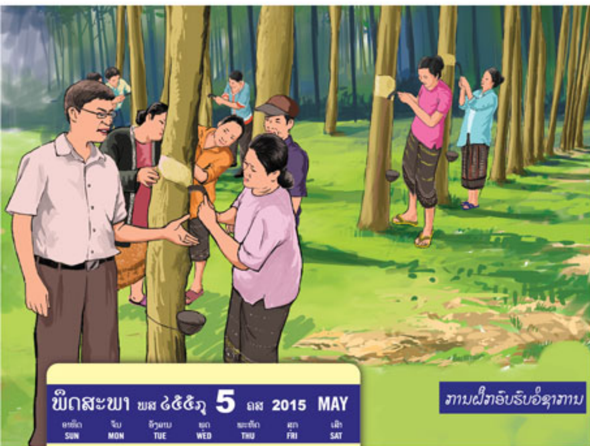
ການຝຶກອົບຮົມອໍຊາການ