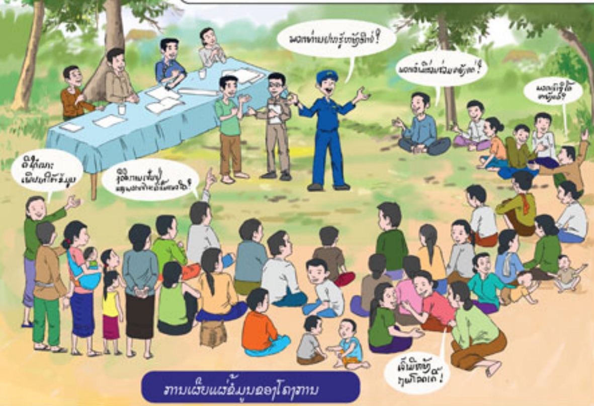
ການເລີຍແລະຂໍ້ມູນຂອງໂຄງການ