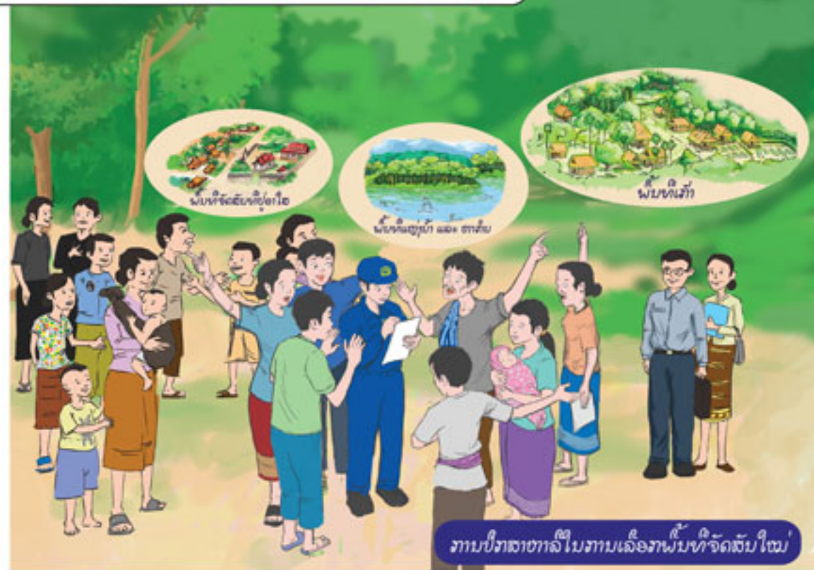
ການປຶກສາຫາລືໃນການເລືອກຜູ້ທີ່ຈັດສັນໃໝ່