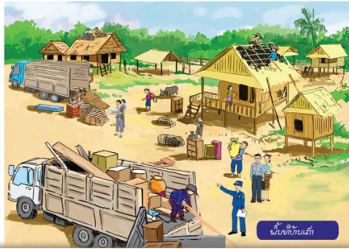
ພື້ນທີ່ເກີດ