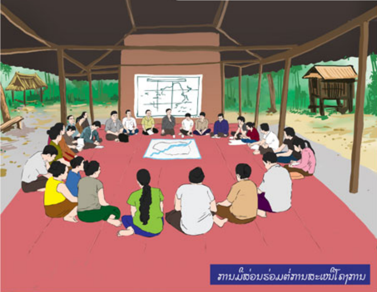
ການມີສ່ວນຮ່ວມຕໍ່ການສະເໜີໂຄງການ