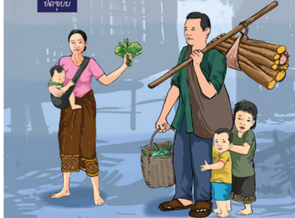
ປັດຈຸບັນ