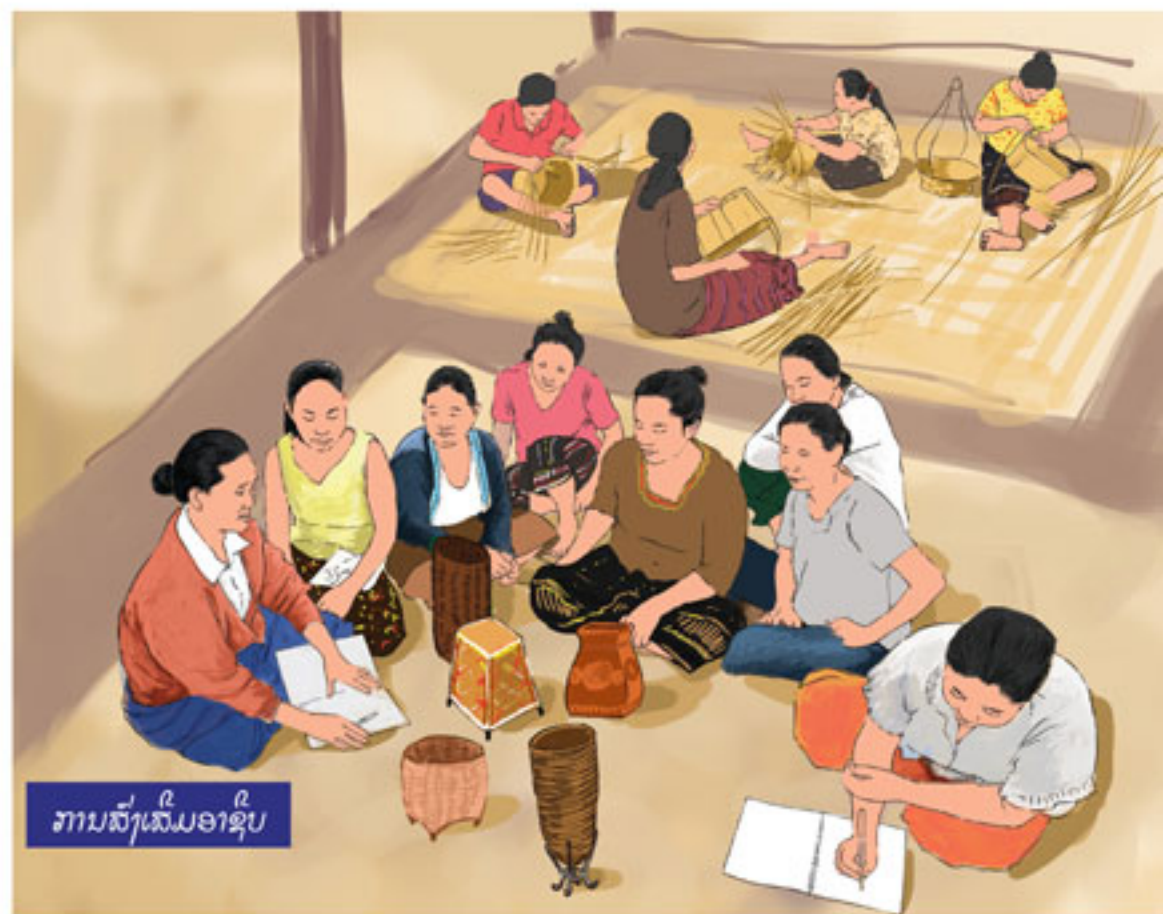
ການສົ່ງເສີມອາຊີບ