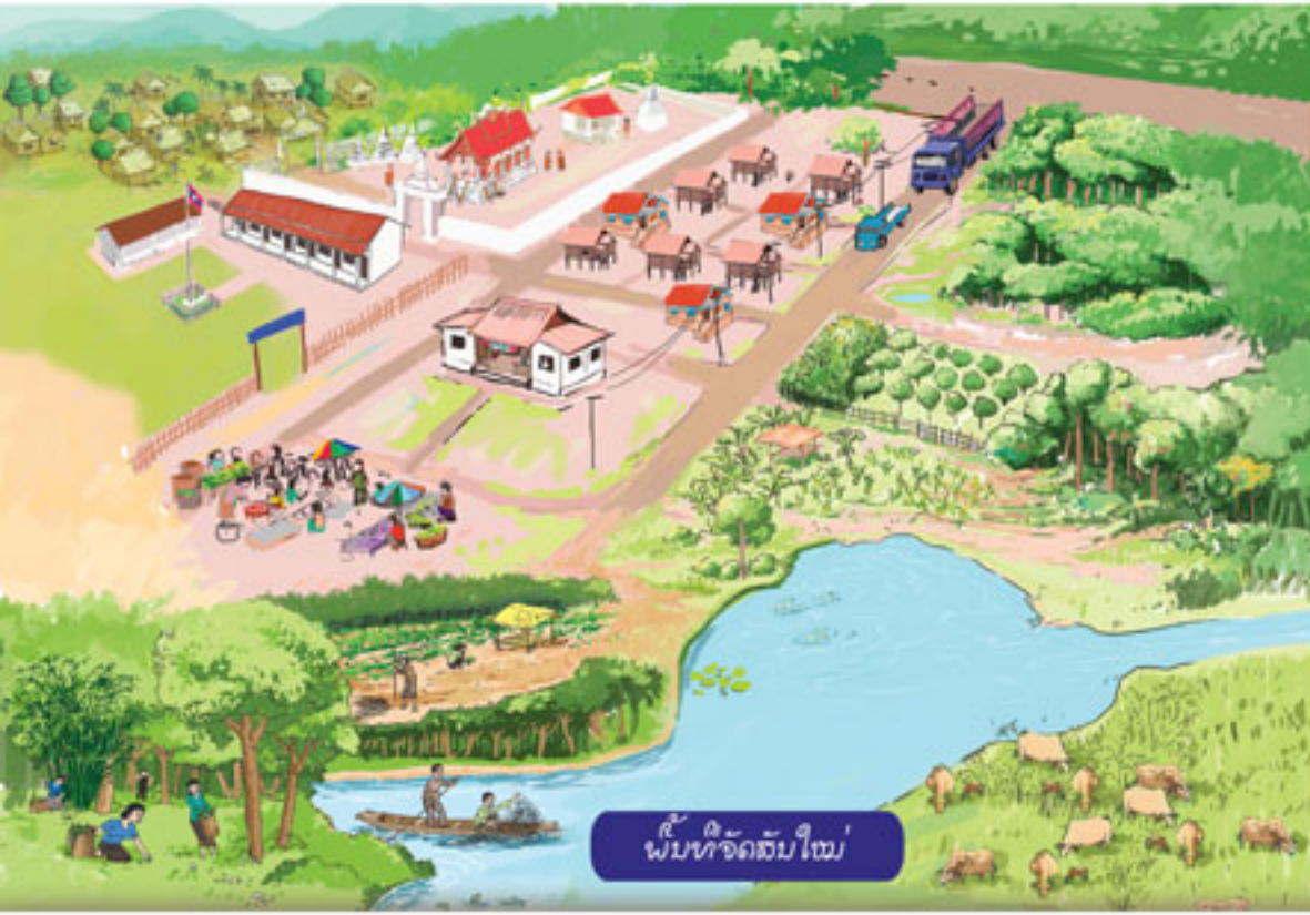
ພື້ນທີ່ຈັດສັນໃໝ່