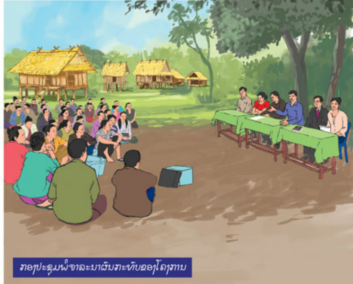
ກອງປະຊຸມພິຈາລະນາຜົນກະທົບຂອງໂຄງການ