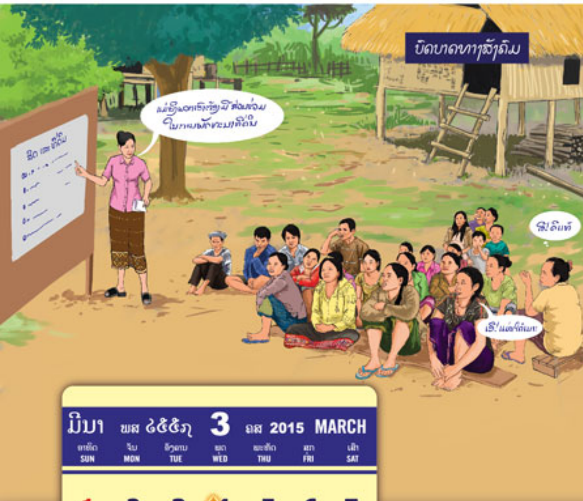
ບົດບາດທາງສັງຄົມ