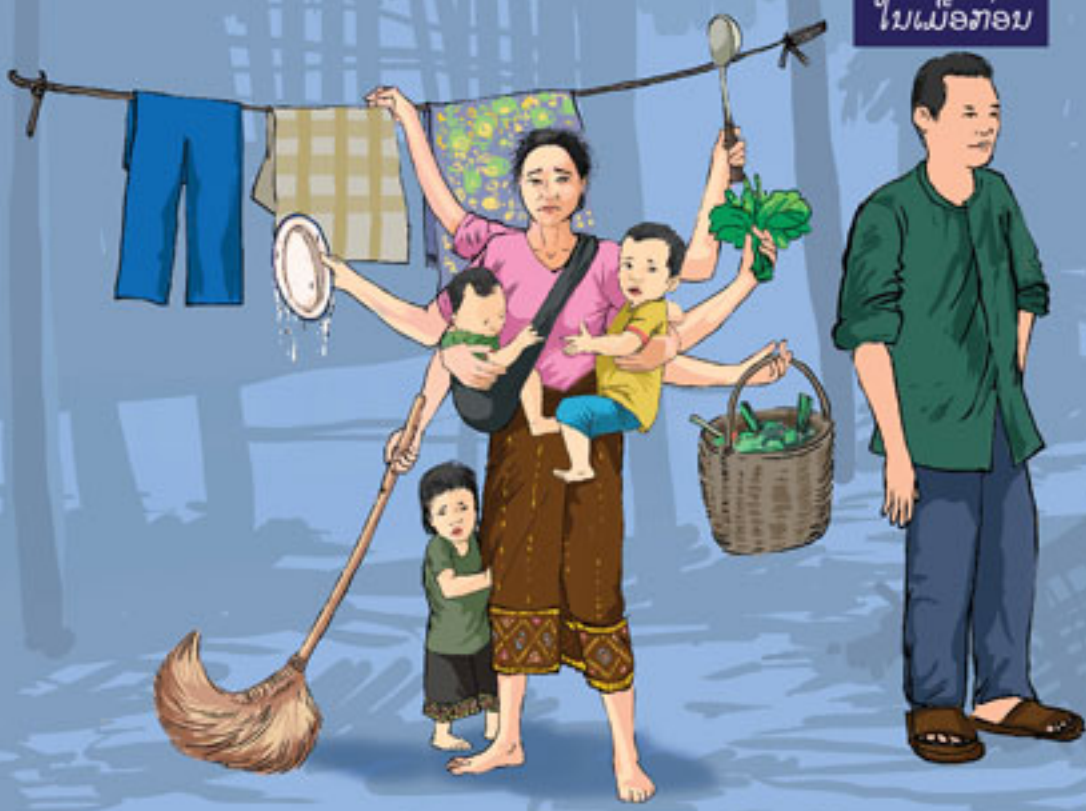
ໃນເມື່ອກ່ອນ