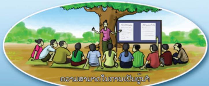
ຄວາມສາມາດໃນການເປັນຜູ້ນຳ