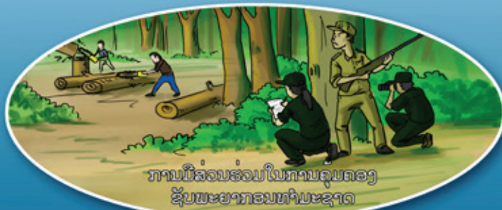
ການມີສ່ວນຮ່ວມໃນການຄຸມຄອງ ຊັບພະຍາກອນທຳມະຊາດ