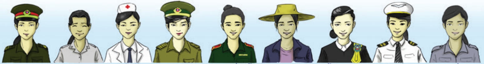
ທະຫານ ຄູ ໝໍ ຕຳຫຼວດ ພ/ງ ປ່າໄມ້ ຊາວນາ ຜູ້ພິພາກສາ ນັກບິນ ພ/ງ ທີ່ດິນ