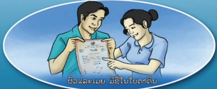
ຜົວແລະເມຍ ມີຊື່ໃນໃບຕາດິນ