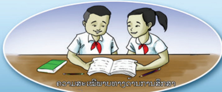
ຄວາມສະເໝີພາບທາງດ້ານການສຶກສາ