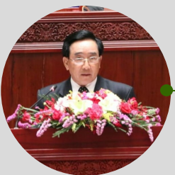
ທ່ານ ພັນຄຳ ວິພາວັນ ນາຍົກຄັດຖະມົນຕີ ແຫ່ງ ສປປ ລາວ

ກ່າວໄວ້ໃນ ກອງປະຊຸມຄັ້ງປະຖົມມະລືກ ຂອງສະພາແຫ່ງ ຊາດ ຊຸດທີ 9 ໃນວັນທີ 22 ມີນາ 2021. ອ່ານເພີ່ມເຕີມ ທີ່ນີ້ .