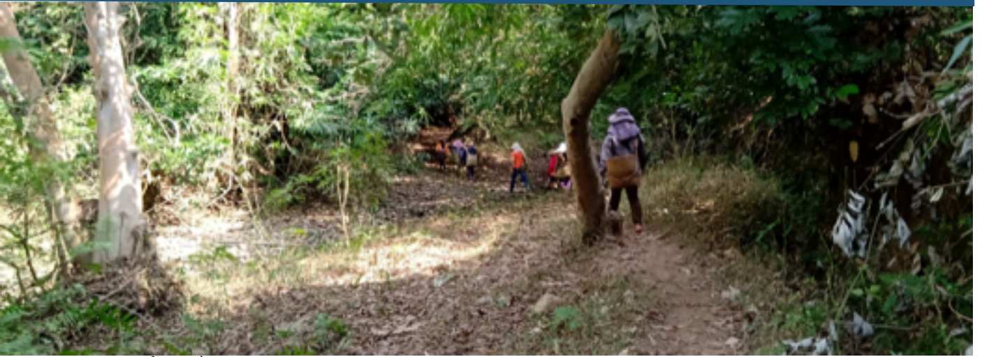
ຊາວບ້ານ ຟິນຮໍ ກຳລັງເຂົ້າປ່າເພື່ອຫາອາຫານ

ໃນລະຫວ່າງຂະບວນການ PLUP, ທີມງານວິຊາການໄດ້ປຶກສາ ຫາລືກັບແມ່ຍິງ ດ້ວຍການແຍກກັນກຸ່ມ ເພື່ອເກັບກຳຂໍ້ມູນກ່ຽວ ກັບການນຳໃຊ້ຊັບພະຍາກອນປ່າໄມ້. ຢ່າງໃດກໍຕາມ, ແມ່ຍິງບໍ່ ໄດ້ຖືກເຊີນເຂົ້າຮ່ວມການສືບທະນາກ່ຽວກັບກິດຈະກຳ ຕັດສິນການຈັດສັນເຂດທີ່ດິນ ຫຼື ນະໂຍບາຍ. ແມ່ຍິງຖືກ ເອີ້ນໃຫ້ມາເຂົ້າຮ່ວມພຽງແຕ່ເວລາທີ່ທີມງານວິຊາການ ນຳສະເຫນີນະໂຍບາຍ ແລະ ກິດລະບຽບທີ່ສ້າງໃໝ່.