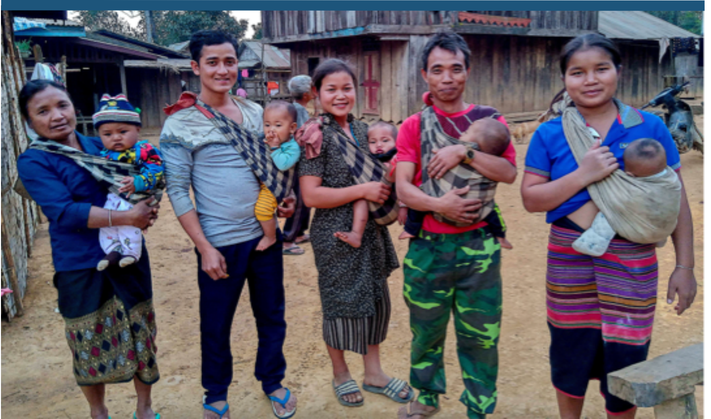
ຊາວບ້ານ ຈາກບ້ານຫາດຈາ