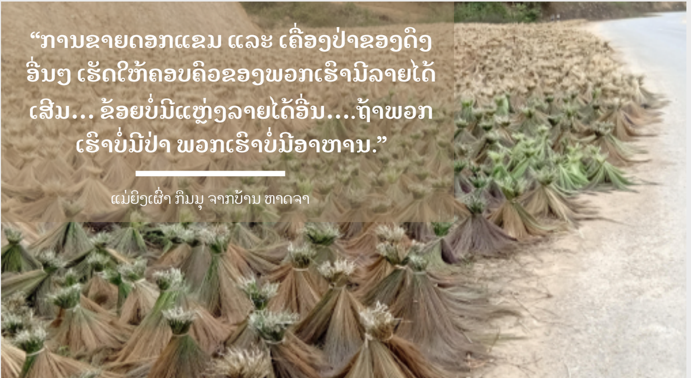
ຫຍ້າແຂມຕາກແຫ້ງຫຼັງຈາກທີ່ຊາວບ້ານຂາຍໃຫ້ຜູ້ຊື້