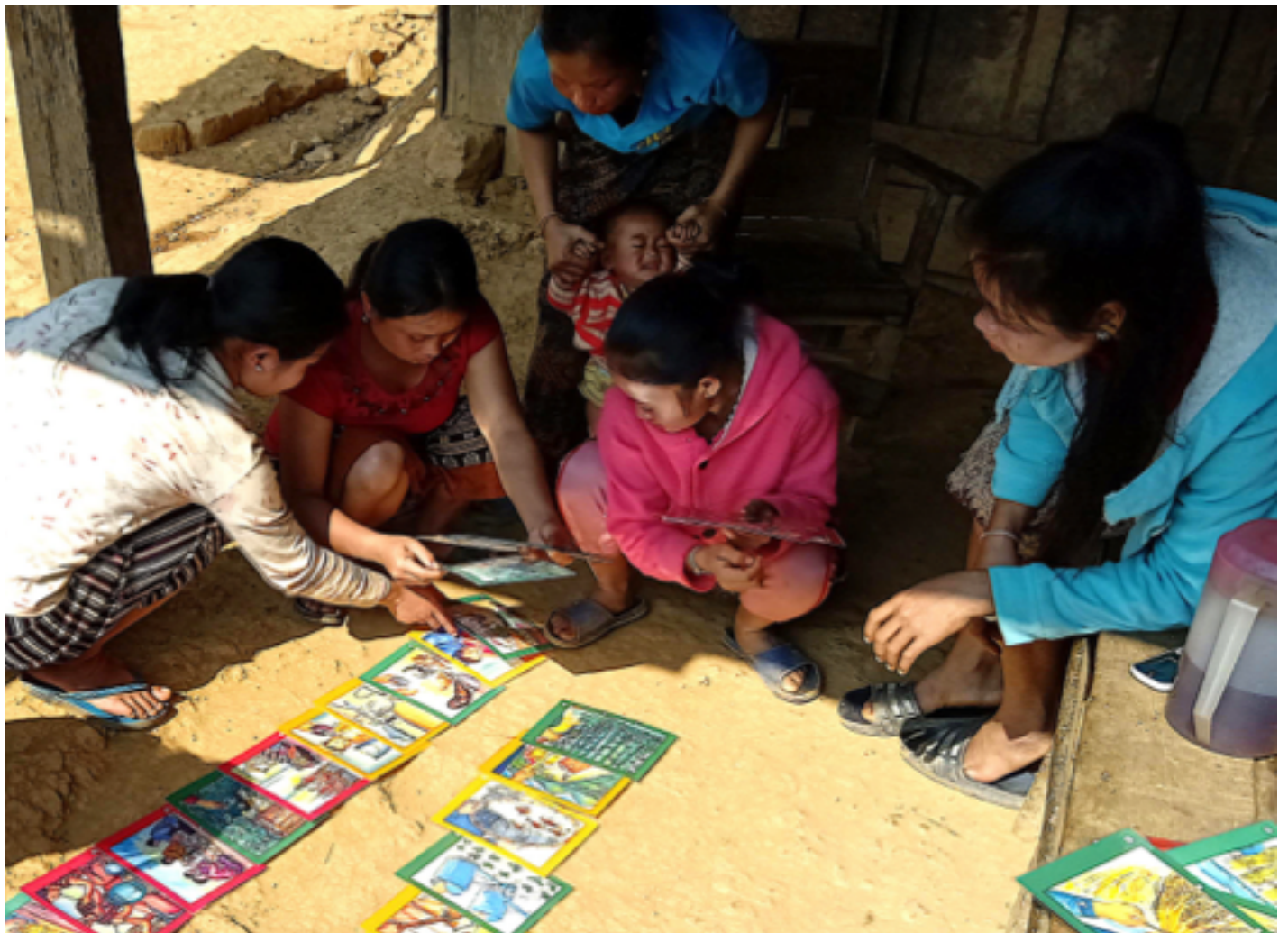
ແມ່ຍິງເຜົ່າ ກິມມຸ ສົນທະນາການແບ່ງວຽກຕາມເພດ ຢູ່ບ້ານ ຫາດຈາ

ການຄົ້ນຄວ້າກ່ຽວກັບສິດຕາມປະເພນີຂອງແມ່ຍິງກ່ຽວກັບ ທີ່ດິນປ່າໄມ້ ແລະ ຊັບພະຍາກອນຍັງບໍ່ທັນມີຫຼາຍ. ບົດສັງລວມ ຫຍໍ້ສະບັບນີ້ແມ່ນອີງໃສ່ກໍລະນີສຶກສາ (ຮູບທີ 1) ທີ່ສຶກສາ ກ່ຽວກັບສິດໃນການເຂົ້າເຖິງທີ່ດິນ ແລະ ປ່າໄມ້ຕາມປະເພນີ ຂອງ ແມ່ຍິງ ໃນບ້ານ ເຜົ່າ ກິມມຸ-ອູ ແລະ ບ້ານ ເຜົ່າ ໄຕຂາວ ຢູ່ ເມືອງໃໝ່ ແຂວງ ຜົ້ງສາລີ.