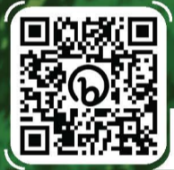
ສະແກນ QR codes ເພື່ອເບິ່ງວິດີໂອຂອງປະຕິທິນ ທາງດ້ານກົດໝາຍ ປີ 2024