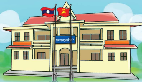
ກົມສົ່ງເສີມລະບົບຍຸຕິທຳ ກະຊວງຍຸຕິທຳ

ການຈັດຕັ້ງໃຫ້ການຊ່ວຍເຫຼືອທາງດ້ານກົດໝາຍມີດັ່ງນີ້: