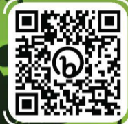
ສະແກນ QR codes ເພື່ອເບິ່ງວິດີໂອຂອງປະຕິທິນ ທາງດ້ານກົດໝາຍ ປີ 2024

ຖ້າພວກເຈົ້າບໍ່ເຫັນດີ ແບບນີ້ ພວກຂ້ອຍຊິໄປ ຊອກບ່ອນອື່ນ.