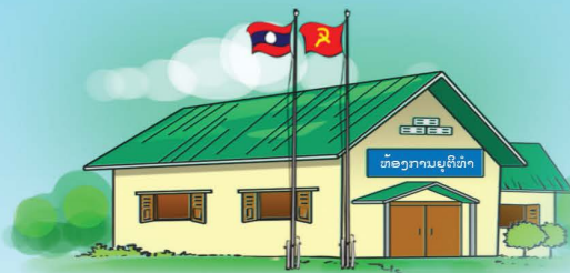
ໜ່ວຍງານສົ່ງເສີມວຽກງານຍຸຕິທຳ ຮາກຖານ, ຫ້ອງການຍຸຕິທຳເມືອງ, ເທດສະບານ, ນະຄອນ