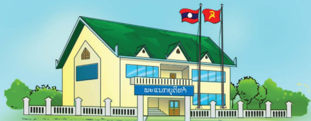
ຂະແໜງສົ່ງເສີມວຽກງານຍຸຕິທຳຮາກຖານ, ພະແນກຍຸຕິທຳແຂວງ, ນະຄອນຫຼວງ