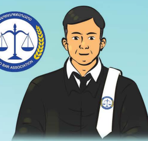
ສະພາທະນາຍຄວາມ