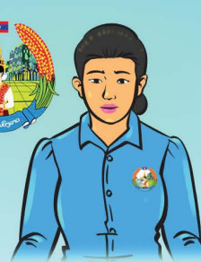
ສະຫະພັນແມ່ຍິງ

ຂ້ອຍຕ້ອງການຄວາມຊ່ວຍເຫຼືອທາງດ້ານ ກົດໝາຍ, ເຈົ້າສາມາດແນະນຳຂ້ອຍແດ່ ໄດ້ບໍ່ ວ່າຕ້ອງເຮັດແນວໃດ?