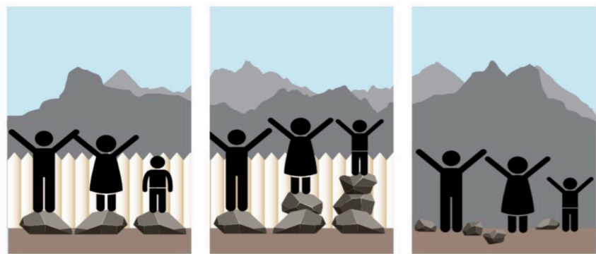
ໄດ້ຮັບການສະໜັບສະໜູນຄືກັນ. ຖືກປະຕິບັດຄືກັນ ໄດ້ຮັບການສະໜັບສະໜູນຕ່າງກັນ. ຖືກປະຕິບັດຕ່າງກັນເພື່ອຄວາມເທົ່າທຽມ ທຸກຄົນສາມາດເຂົ້າເຖິງ ແລະ ມີຄວາມເໝີພາບໂດຍບໍ່ຈຳເປັນຕ້ອງມີການສະໜັບສະໜູນໃດໆເມື່ອອຸປະສັກ ຫຼື ສິ່ງກົດຂວາງໝົດໄປ